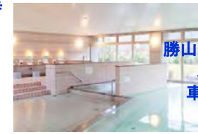
勝山温泉センター 水芭蕉 車で20分