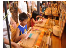
ゆめおれ勝山 (はたや記念館) 車で25分