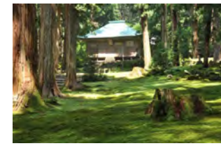
白山神社平泉寺 車で35分