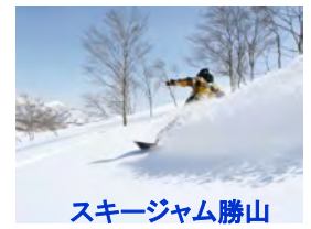
スキージャンプ勝山 車で30分