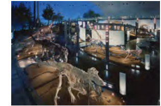
かつやま恐竜の森 (福井県立恐竜博物館) 車で20分