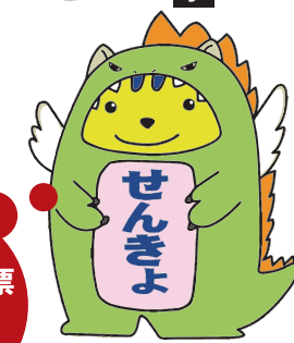
明るい選挙キャラクター 福井県版「めいすいサウルス」

選挙は、私たち国民が政治に参加する最も重要な機会です。一人ひとりが自覚と良識をもって、1票を投じましょう。