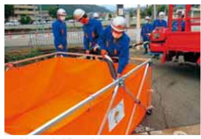
簡易水槽3基は、火災現場の水源確保で有効に活用します。