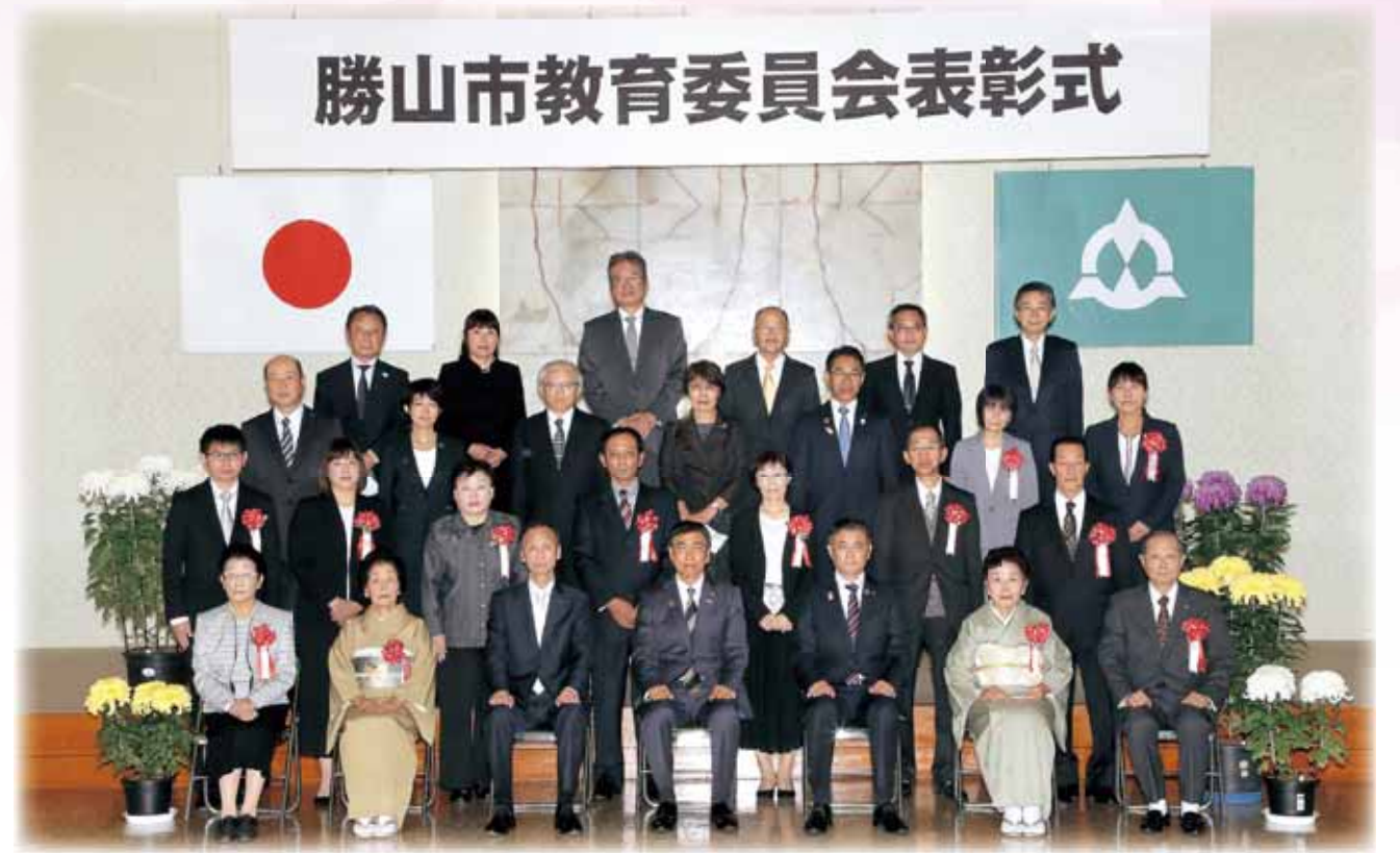
教育会館において11月3日、文化や学校教育、スポーツなど各分野で功績のあった26の個人および団体が表彰されましたのでご紹介します。(順不同、敬称略、児童、生徒は各学校で表彰済み)