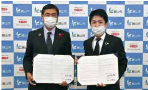
10月19日 第一生命保険㈱と包括連携協定を締結