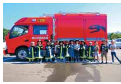
子ども用防火衣7着は、消火訓練の体験で着用して活用します。