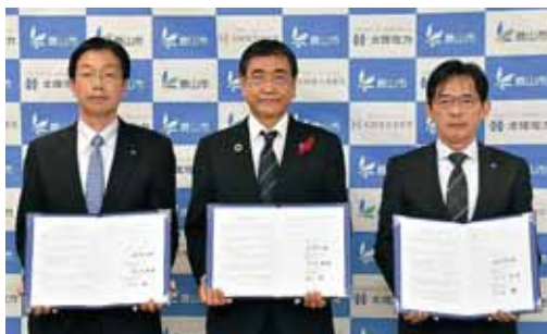
10月26日 北陸電力㈱と北陸電力送配電㈱と包括連携協定を締結