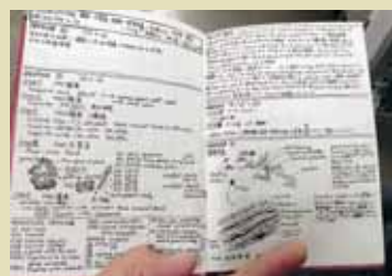
町の学生時代のフィールドノート

地質調査の三種の神器といえばハンマー、クリノメーター、ルーペがしばしば挙げられます。ハンマー▼岩石の風化面を取り除く、サンプルを採取するクリノメーター▼地層の傾きなどを調べる(方位磁石付き)ルーペ▼岩石の断面や化石を拡大する