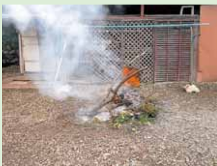
地面で直接物を燃やしたり、ドラム缶やブロック積み、簡易焼却炉などでゴミを焼却するのは法律違反です