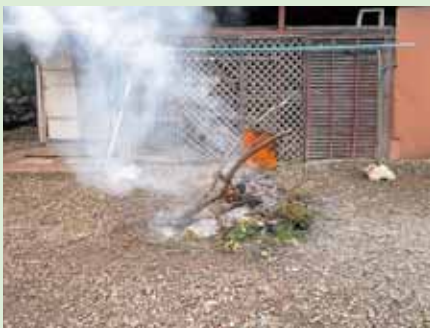
地面で直接物を燃やしたり、ドラム缶 やブロック積み、簡易焼却炉などでゴ ミを焼却するのは法律違反です

例外もありますが、煙や悪臭で周 囲の迷惑、交通の障害となっている など、必要最小限度のものとして認め られない場合や一般のゴミと一緒に燃 やしたといった場合には野外焼却は 認められず、行政指導の対象になり ます。