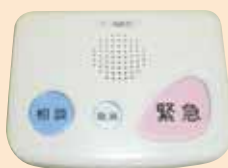
緊急通報システム(シルバーコール)