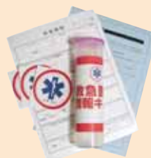
救急医療情報キット