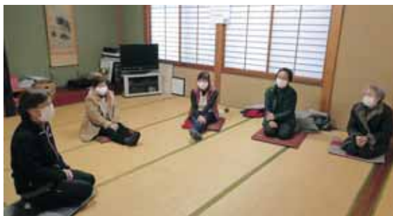
沢地区ミニサロンの様子