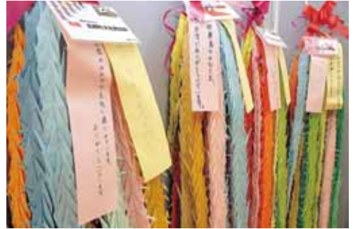
感謝のメッセージが添えられた千羽鶴

12月19日、北郷町が同町の文化祭で企画した千羽鶴プロジェクトで作成した千羽鶴1万8,000羽を勝山市医師会に贈りました。