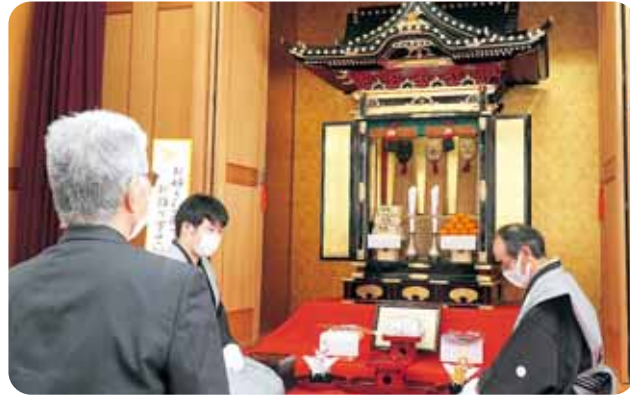
■2月13日 北谷町谷区教会