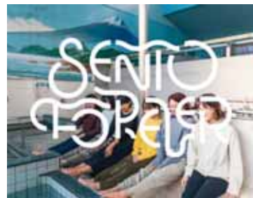
SENTO FOREVER がサウナグッズなどを販売

この日は感染防止対策として5人以下で3回に分けて体験を実施。 マウスシールドを着用、テント内を喚起するなどして11人が欧風サウナを楽しみました。