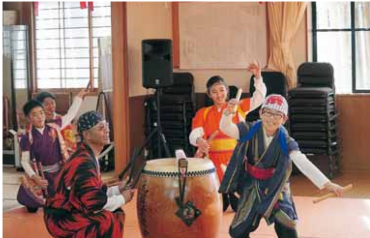
元町2丁目区の太鼓披露