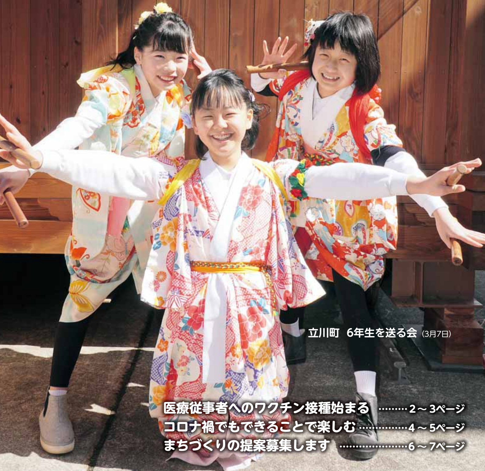
立川町 6年生を送る会 (3月7日)

医療従事者へのワクチン接種始まる ..... 2~3ページ コロナ禍でもできることで楽しむ ..... 4~5ページ まちづくりの提案募集します ..... 6~7ページ