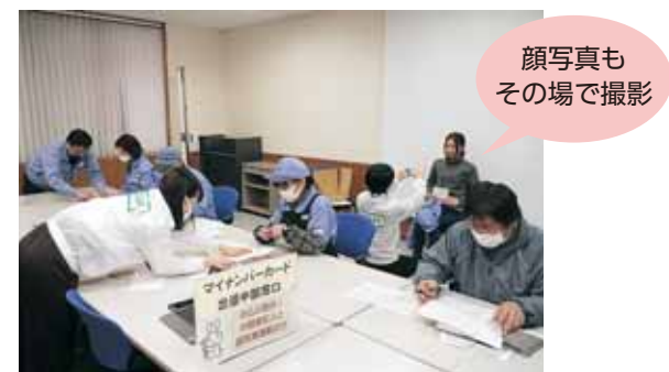
出張申請の様子（横フクタカ）

市職員が地区公民館や職場などに出向き、マイナンバーカードの申請受付を行います。 カードの受け取りもご指定の場所で行えます。