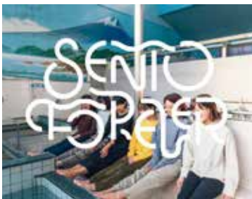
SENTO FOREVER がサウナグッズなどを販売

マウスシールドを着用、テント内を喚起するなどして11人が欧風サウナを楽しみました。