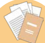
パブリック コメント募集