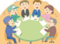
市民意見交換 ワークショップ