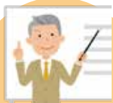
専門家による 政策提言