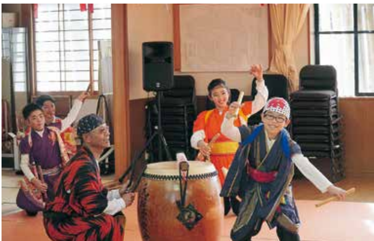
元町2丁目区の太鼓披露