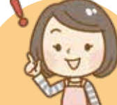
テーマ別 政策提案募集