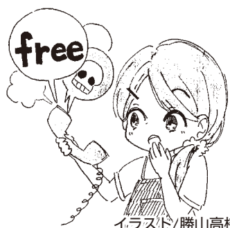
イラスト/勝山高校芸術部

Q1 家に「化粧品の無料サンプルをお母さん宛に送ります。とお伝えください。」という電話があった。子どもの私が聞いてしまいましたが、大丈夫でしょうか。(女性、10代)