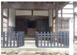
写真3 現在の社務所