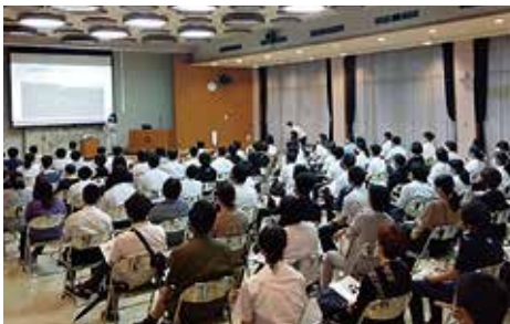
新学科説明会の様子