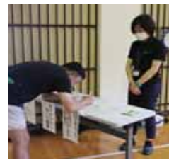
保護者会にて申請受付

企業の職場などでマイナンバーカードの申請・受け取りができる出張申請サービスを実施しています。また、イベントなどにも出張申請のみができます。