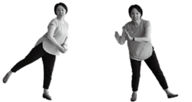
掃除機をかけながら 窓ふきしながら