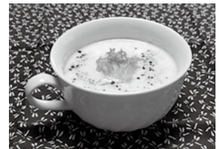
暑い日や食欲のないときにオススメです。

じゃがいも1個 / 玉ねぎ(小) 1/2個 / 牛乳200cc / コンソメ顆粒小さじ1 / 水200cc / バター10g / 塩、コショウ少々 / 刻みパセリ(緑の葉など)少々