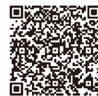
Google Play (Android)