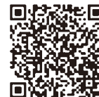
アプリの詳細 はこちら