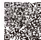
App Store (iOS)