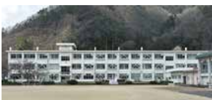
現在の北郷小学校

川・志比原・檜曾谷・西妙金島・堀名中清水・伊波・妙金島の7区で設立されたものです。以後、区の移動や一時廃校もありましたが23年に再開設されました。明治7年には伊知地に坂東島・岩屋・東野4区で鷺巣小学校が(右屋は途中分離、さらに分教場に)、19年には堀名に伊波・森川・志比原・西妙金島区で壇ヶ城小学校が設立されました。 その後、明治41年に北郷尋常高等小学校が、松尾と鷺巣小学校が統合して成立しました。最初は東野区に後に檜曾谷に移転しました。なお、伊知地と右屋区には分教場が置かれました。戦後の昭和22年(1947)、新学制により村立(後市立)の北郷小学校が檜曾谷に設立、その後、東野に移転し現在に至っています。