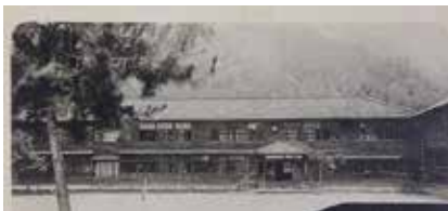
昭和8年頃の北郷小学校