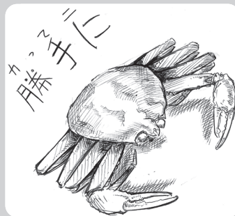
イラスト/勝山高校芸術部

A 消費者センターから電話したところ、すぐにつながり、クーリングオフ(契約してから8日間)の期間だったため、ハガキを出してキャンセルすることができました。