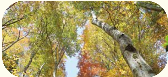
黄葉の谷のブナ林 (11月上旬)

谷区の魅力を語る上で外せないのがブナ林です。このブナ林はなだれの発生を防いだり、勢いを弱めたりするための保安林として、谷区の人に大切に守られてきました。