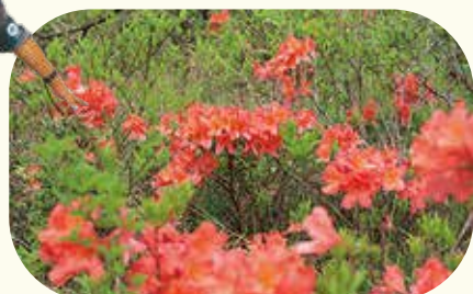
レンゲツツジ (見頃は5月～6月)