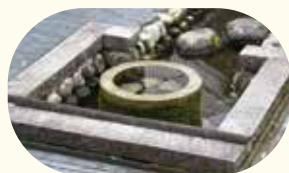
伏流水(地下に浸透した水)が湧き出る大清水