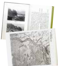
写真や地図などが掲載され、当時の様子がよく分かる

「鹿谷村史」は、市内のまちづくり会館や図書館、市内各学校(小・中・高)などで読むことができます。