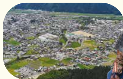
山頂からの景色(ドローン撮影)

一年を通して、市街の風景と山城ならではの遺構を楽しめます。特に、3月下旬から4月下旬にかけては山城の遺構が確認しやすいだけでなく、桜と残雪が輝く山々の風景が美しいので、ハイキングにおすすめです。