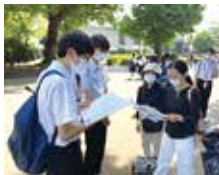
パンフレットを手渡し