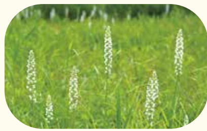
貴重な湿地植物のミズチドリ (見頃は6～7月)