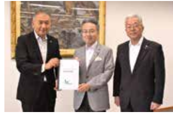
左から水上市長、杉本知事、田中県議