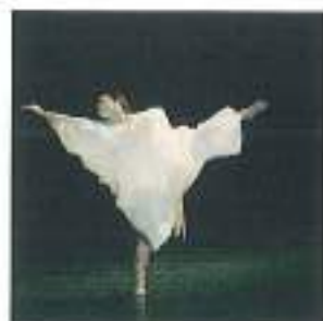
柴野 由里香 (Shibano Yurika)