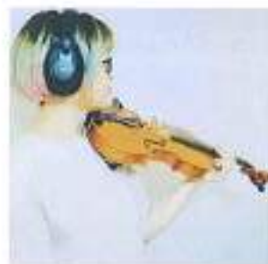
鹿嶋 静 (Kashima Sizuka)