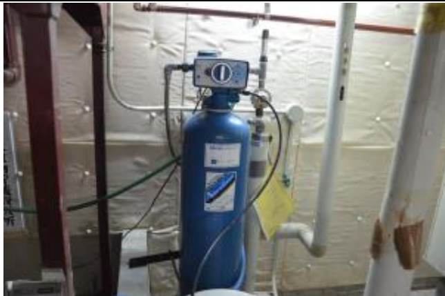
軟水装置 × 1 台 機械室 2 階