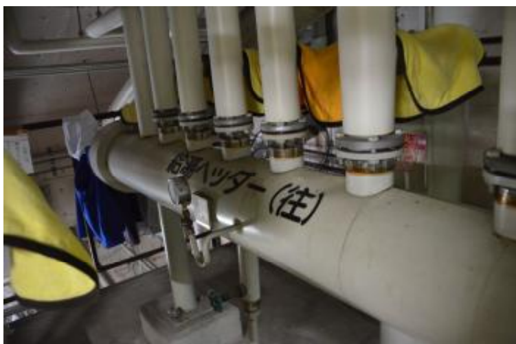
給湯往ヘッダー 機械室 2 階