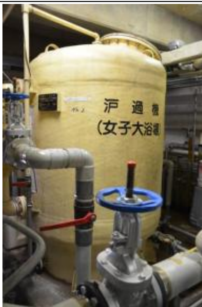
ろ過機×6台 機械室1階

女子水風呂 令和元年取替 男子水風呂 平成21年取替 女子丸風呂 平成13年取替 男子丸風呂 平成2年製造 ※令和7年取替予定 女子大浴槽 平成2年製造 ※令和7年ろ過材取替予定 男子大浴槽 平成2年製造 ※令和7年ろ過材取替予定