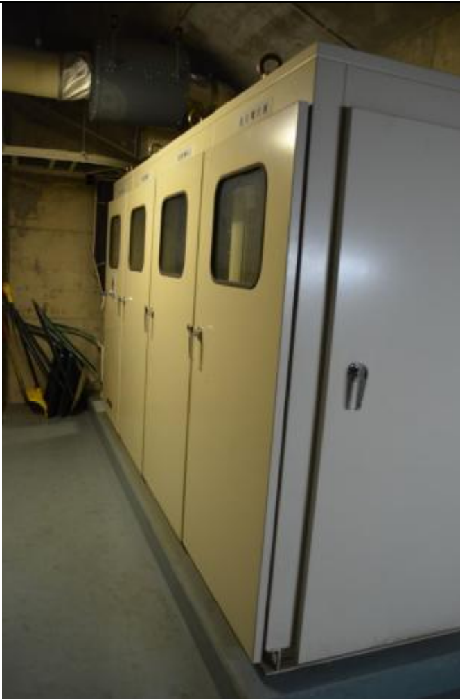
電気設備 機械室 2 階