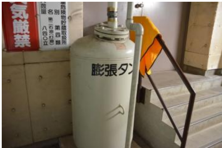
膨張タンク 機械室 2 階