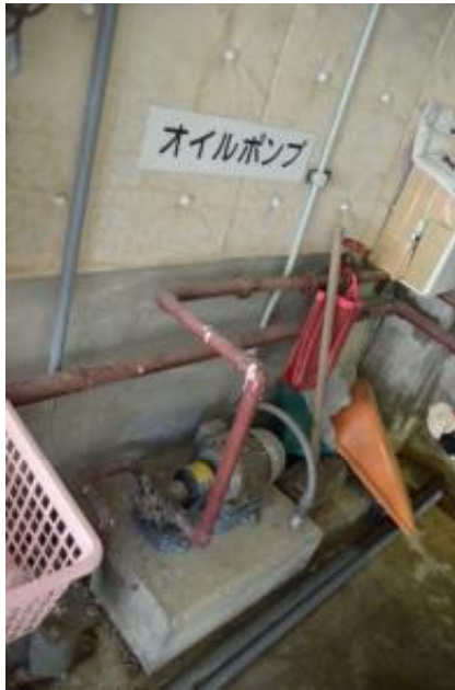
オイルギアポンプ×1台 機械室1階