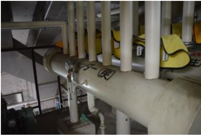
給湯戻ヘッダー 機械室 2 階