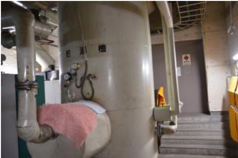
貯湯槽 機械室 2 階