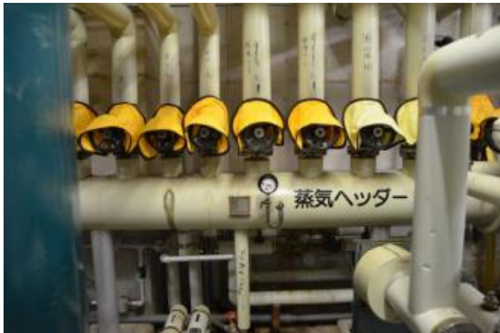
蒸気ヘッダー 機械室 1 階