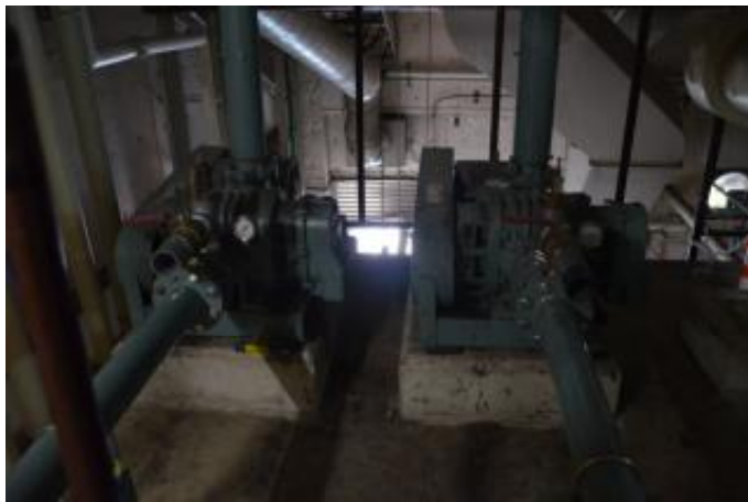
ブロワー 2 台 機械室 2 階