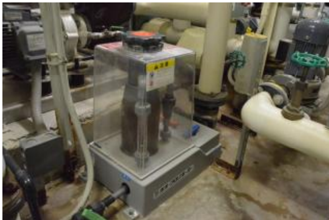
薬注ポンプ×6台 機械室1階