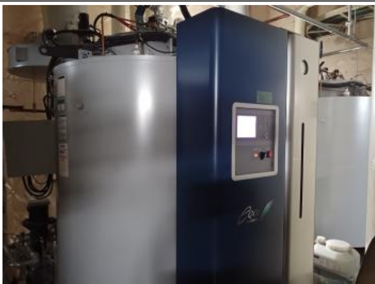
ボイラー 機械室 2 階