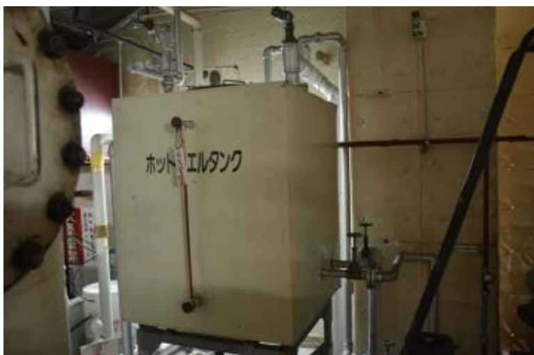
ホットウェルタンク 機械室 2 階