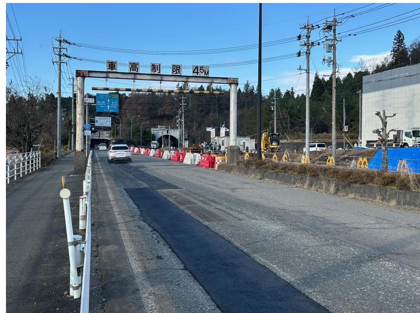
④二次施工完了(交通開放)