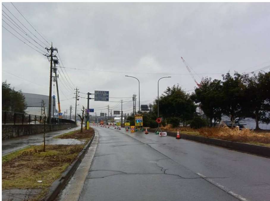
③三次施工交通規制