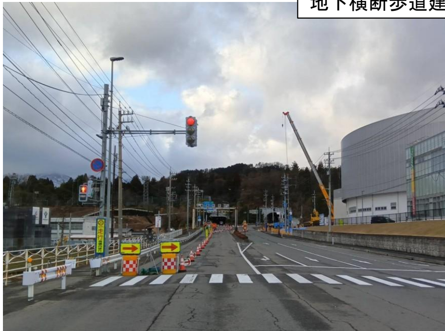
①三次施工交通規制