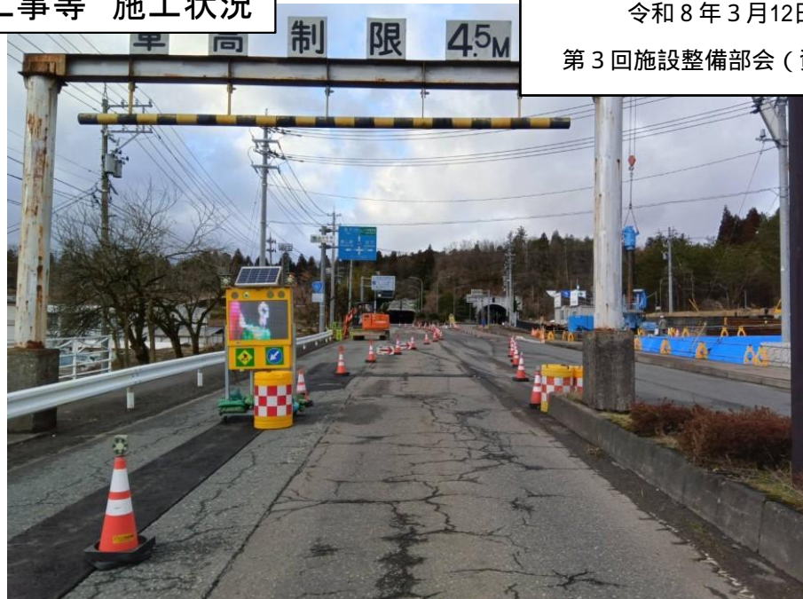
②三次施工交通規制