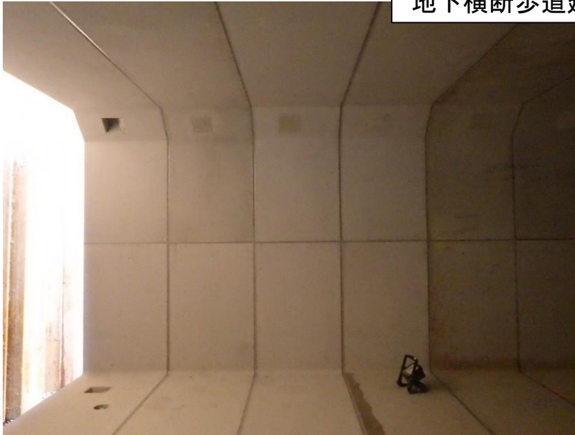
①二次施工据付完了