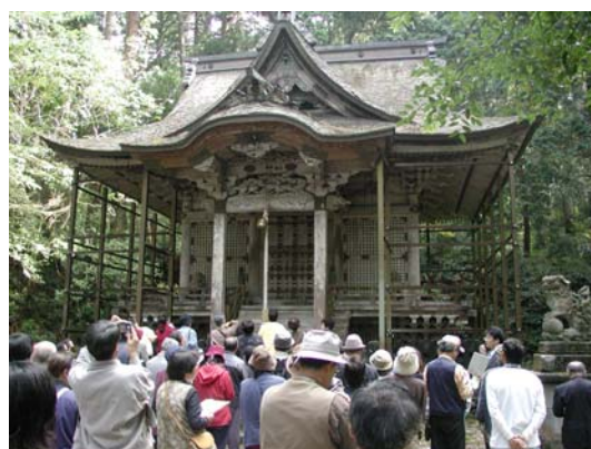
勝山市観光ガイドボランティアクラブ による白山平泉寺の案内