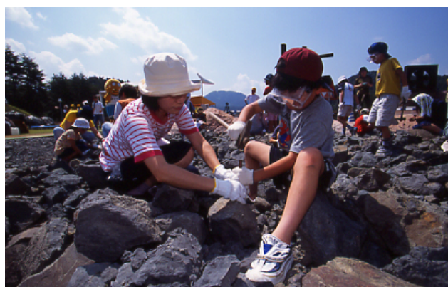
勝山市長尾山総合公園内の 恐竜化石発掘体験