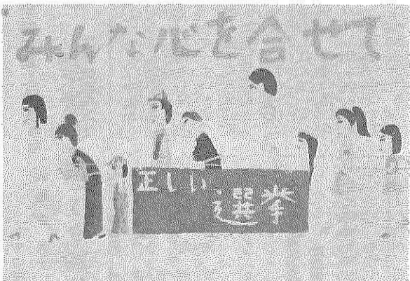
勝山市明るい選挙推進協議会 勝山市選挙管理委員会