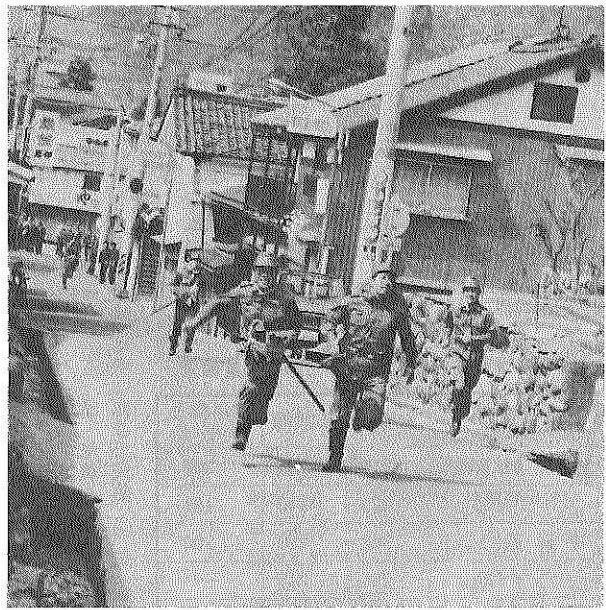
▲力走する各分団選手

午前八時のサイレンとともに出勤し、活発な消火訓練を展開、続いて、立川一丁目付近の西環状線で全消防車が一斉に放水を行いました。 このあと、本町通りで分列行進が行われ、本部長(池田市長)の観閲を受けました。 伝統の「走りやんこ」は、午前十時十分から、A組、B組に分けて行われました。 市長の振る旗を合図に、後町通りの北陸電力勝山営業所の前を出発、長山公園までの約二キロを、十四人の選手たちが制服、長くつ姿で、重さ三キロのまといを持って力走しました。 長山公園の登り口では、次の走者にまといをほり上げて渡すという妙技もあり、見物の市民からも盛んな声援があがっていました。 「走りやんこ」の成績は次のとおりです。 A組 ①七分団、②十分団、③十一分団 B組 ①六分団、②九分団、③八分団