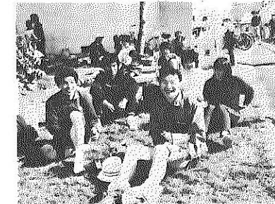
▲スタート前にくつろぐ選手たち