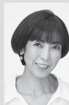
講師 大林素子氏 (元全日本バレーボール選手・NHKバレーボール解説者)

大林素子さんを講師に迎え、市内中学生を対象にバレーボール教室を開催します。観覧は自由です。ぜひお越しください。 ※教室参加者の公募は行いません