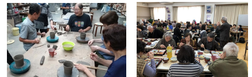
陶芸・ガラス体験(社協) にこにこ交流会(さわらび会)

【来年1月交付】【来年4月交付】分は、10月上旬までに申請書類を市に提出の予定です。