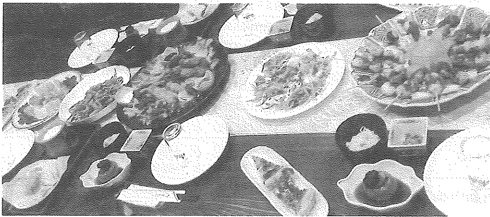
夕食(写真はイメージです)