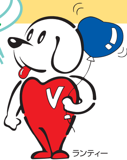
ランティー 「ランティ」は、福井県の ボランティア・シンボルです