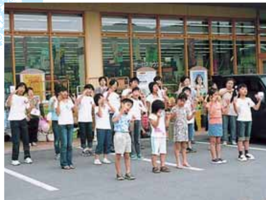
市民のみなさんが見守る中、「世界が一つになるまで」「てのひらを太陽に」の手話コーラスを発表

ハンドフレンズ養成講座の受講者による手話コーラス発表が、10月1日、赤い羽根共同募金のオープニングイベントとして行われ、受講者19名が、約3ヶ月間にわたる練習の成果を堂々と発表。講座の集大成を飾るとともに、赤い羽根共同募金のスタートを大いに盛り上げてくれました。全9回にわたって開講されたこの講座も、10月15日(土)の修了式をもって閉講します。