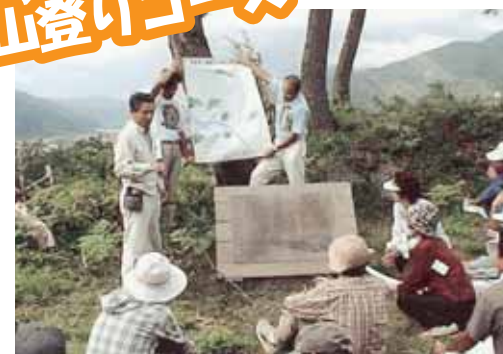
頂上で村岡山の歴史を学びました