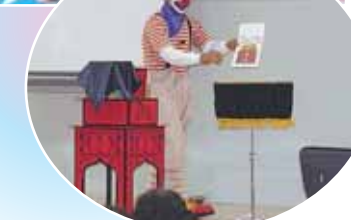
K & ピエロのマジックショー! 笑いをたくさんいただきました