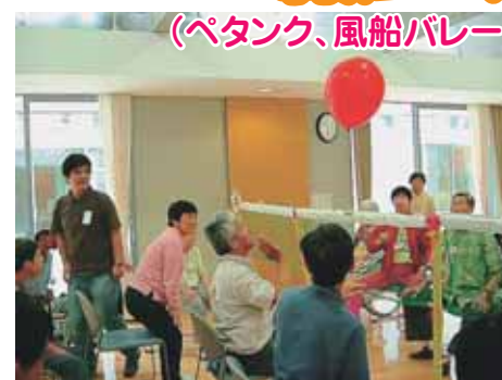
風船バレーでハッスル!ハッスル!