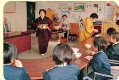
文化祭で、お茶をたしなむ児童ら

● 文化祭を小学校で開催 ● 児童と町民がいっしょにいろいろな作品を鑑賞し、お茶や押し花などの文化的体験をしました。