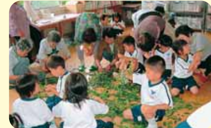
昔は、こんな遊びをしていたんだね

● 地域のお年寄りとの交流 ● お年寄りのかたから、植物を細工した生き物づくりを習いました。フジの葉のムカデやショウブの葉のカタツムリを作りました。