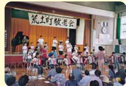
一生懸命演奏する姿をやさしく見つめるお年寄りたち

● 文化祭や敬老会で活躍 ● 敬老会で演奏、文化祭で歌と合奏の発表をするなどして、地区のかたに楽しんでもらいました。