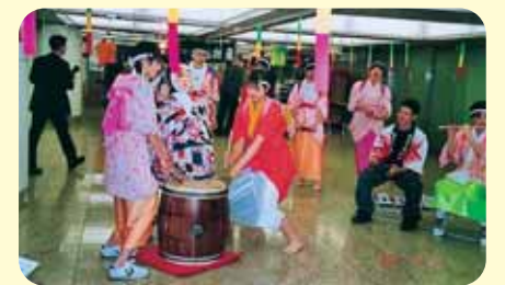
東京で勝山のPRに一役!

● 東京で勝山をPR ● 修学旅行時に、新宿駅西口で手作りCM流しや左義長ばやしの実演を行い、勝山をPRしました。