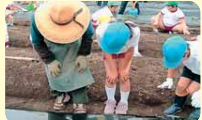
野菜づくりを通じて、食のたいせつさを学びます

● みんなで畑づくり ● 学校の近くに畑を借り、地域のかたの指導を受けながら、いろいろな野菜の苗の植え付けから収穫までを体験しました。