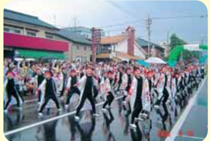
かちやまワッショイを盛り上げる児童ら

● かちやまワッショイに出場 ● 地域・家庭・学校がひとつになり、踊りを通じた表現活動に取り組みました。