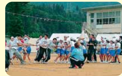
大人も子どももいっしょに綱引き!

● 地域と学校の行事 ● 作物の収穫を感謝し、歌や劇などを地域のかたに発表しました。また、鹿の子運動会では、地域のかたを招いて地域のかたとの交流を深めました。