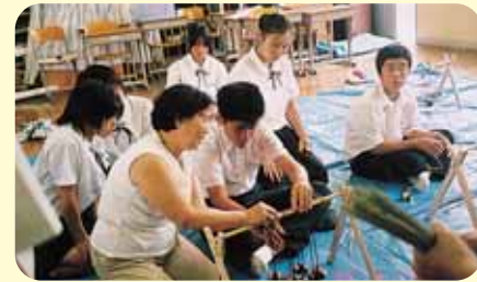
体験コーナーで、地区のかたから指導を受ける生徒たち

● 地域とつながった学校祭 ● 学校祭で、学校と地域を結ぶ活動「地域とのパートナーシップづくり」を合言葉に、体験コーナーや地域のかたの発表がありました。このほかにも町民運動会の大会運営への参加や、地域への奉仕活動に取り組みました。