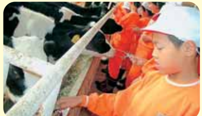
牧場体験で牛に餌をやる児童ら

● 保育園や独居老人らとの交流 ● 保育園との交流や、野菜作りを通じた独居老人との交流、施設訪問など地域との交わりに積極的に取り組みました。長期宿泊体験活動では、牧場体験や野外炊さん体験などを行いました。