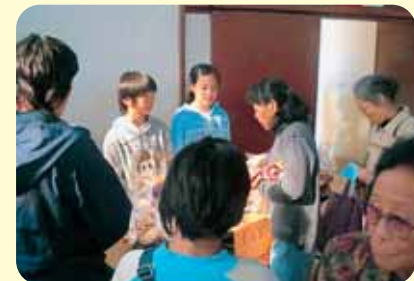
自家栽培のしいたけなどを文化祭で販売

● 栽培、収穫そして販売 ● しいたけやなめこの栽培を地域の壮年会のかたなどから指導を受け、収穫したものを文化祭で販売しました。