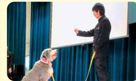
命のたいせつさを学ぶ講演会

● 教育講演会を開催 ● 獣医の先生を招いた講演会では、生徒らが犬のしつけを通して、自分の命について考えました。