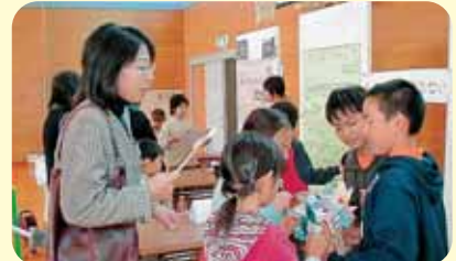
発表会では学習の成果を親子に説明

● テーマを決めて、地域のかたから学習 ● 各学年で学習テーマを決め、そのテーマに沿った学習をする中で、地域のかたからいろいろ教わりました。お世話になった方を呼んでの発表会や感謝状の贈呈をしました。