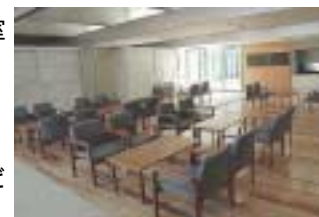
展示交流スペース