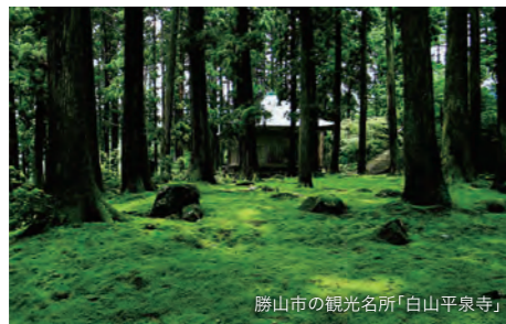
勝山市の観光名所「白山平泉寺」