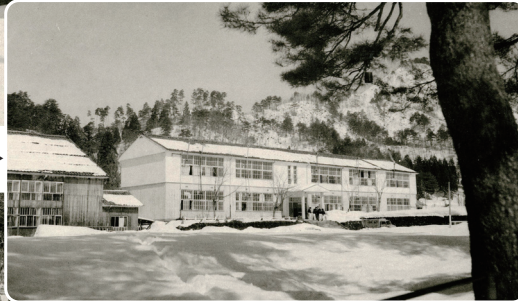
中部中学校野向教場▶