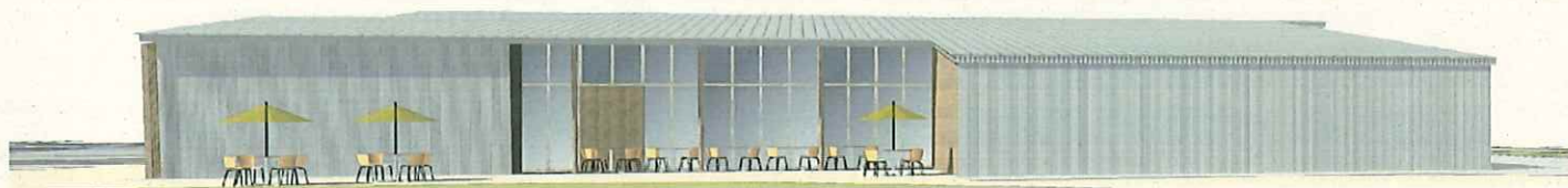
建物裏側（九頭竜川方向から）ビュー