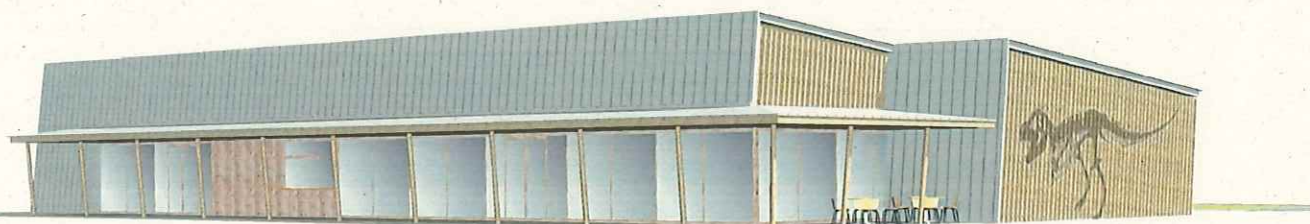
建物正面（県道勝山丸岡線から）ビュー