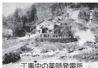
工事中の薬師発電所