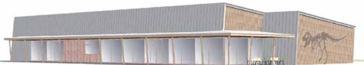
建物正面（勝山丸岡線から）