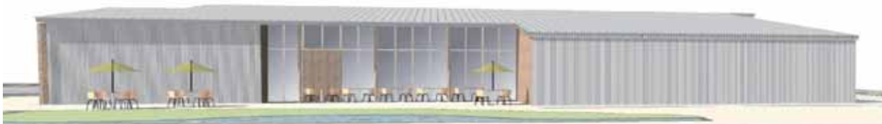
建物裏側（九頭竜川から）