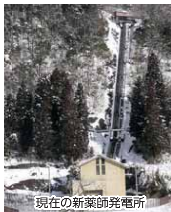
現在の新薬師発電所

今回は中尾と薬師の発電所について紹介します。 勝山の基幹産業である織物業は、明治40年代に入ると力職機による生産が急速に増加する。その動力源として重要な役割を果たしたのが水力発電である。電力は繊維産業だけでなく、大正3年(1914)に開通することになる、越前電気鉄道(京都電燈(株)傘下)の動力としても必要であった。 京都電燈(株)は滝波川を利用して明治41年(1908)には北谷村中尾に、同43年には野向村薬師に発電所を建設した。中尾発電所で使用されていた発電機は同41年製造の米国製で、北陸管内で唯一残る製品で市の文化財に指定されている。この発電機はゆめおれ広場に移設し、4月から公開展示の予定である。