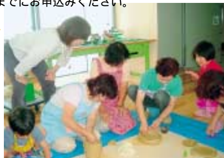
子どもたちに陶芸の指導をする ボランティアのみなさん