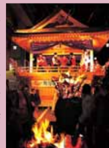
かがり火に浮かび上がる左義長やぐら