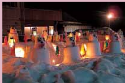
雪灯籠で新たな夜のおもてなし

奥越に春の訪れを告げる「勝山左義長まつり」が、2月25、26日に行われ、約8万5千人の出入で賑わいました。 各町内に設けられたやぐらでは、笛や三味線の音に合わせてにぎやかなお囃子がまわりに響きわたり祭りムード一色となりました。 見物客らは、男衆のユーモラスなしぐさや女衆の艶っぽいバチさばき、楽しいしぐさで太鼓を打つ子どもたちの姿に、微笑を浮かべ目を細めながら眺めていました。 多くの見物客が見つめる中で、一心不乱に浮かれ太鼓を演じながら、厳しかった冬を乗り越え、春を迎える喜びを伝えていました。