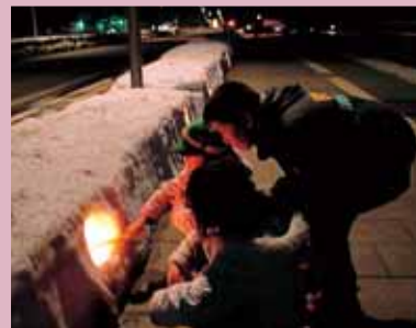
青年団体連絡会が勝山橋に作った雪灯籠に明りを灯す 三室小学校の児童たち