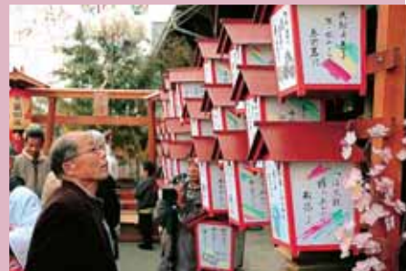
押し絵や作り物、行燈が道行く人々に昔ながらの遊び心を伝えます