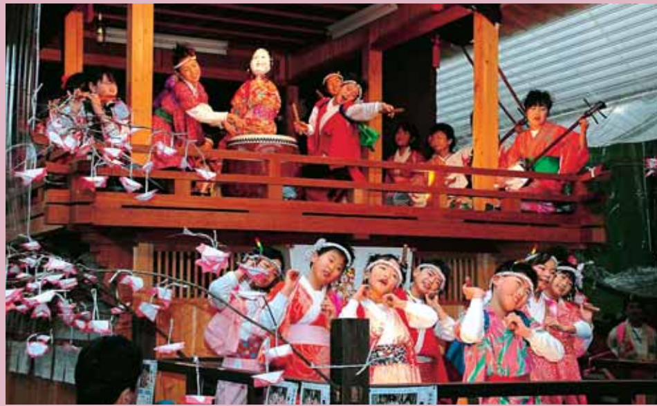
子どもばやしコンクールで熱演する子どもたち