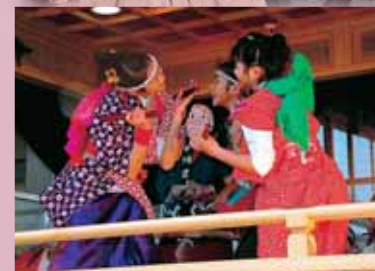
大人顔負けの“浮き”で見物客らを魅了する