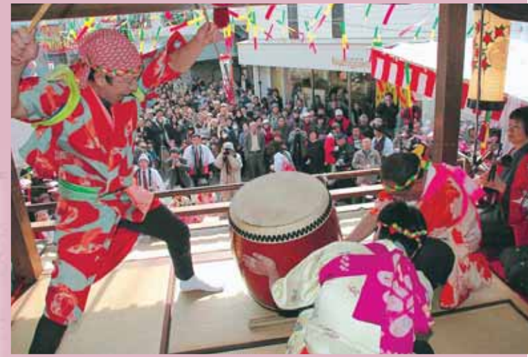
下長瀬やぐらの一番太鼓で左義長まつりの幕が切って降ろされました