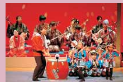
若者グループ「新炎会」主催による市内園児のチビッコ太鼓