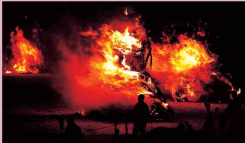
祭りのフィナーレ「ドンドコ焼き」で、14基のご神体にご神火が点けられると、会場は赤々と燃え盛る炎の競演が繰り広げられます