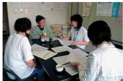
和やかな雰囲気専門員らと語り合う高齢者

高齢者に関することは、いつでもお気軽にご相談ください。保健師、主任介護支援専門員、社会福祉士の専門職員がチームを組んでさまざまな関係機関と連携をとりながら、支援を行っていきます。