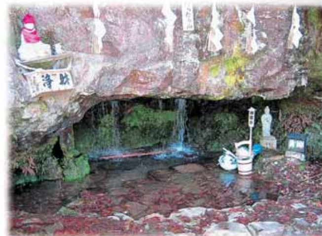
たらたら山「白竜の滝の霊水」 村岡町浄土寺