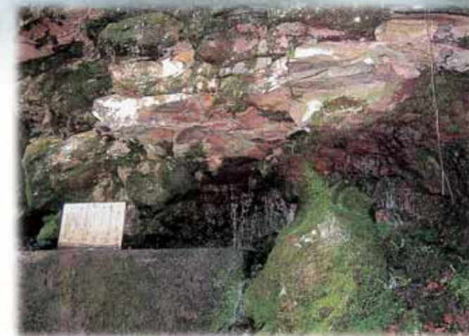
滝之堂 平泉寺町平泉寺