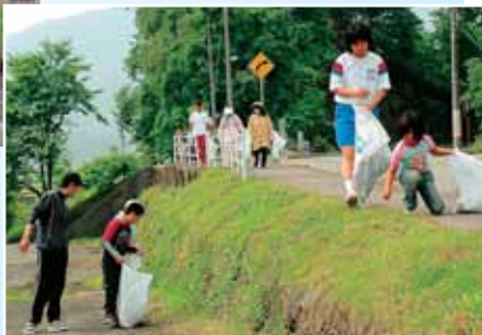
遅羽町クリーンアップ大作戦