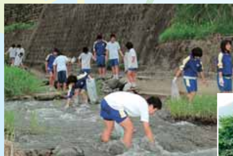
中部中学校生徒による浄土寺河川清掃