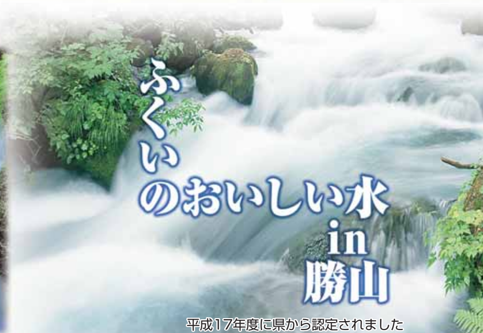
平成17年度に県から認定されました