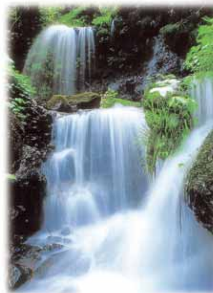
神谷の水 村岡町神谷

環境省では、6月を「環境月間」と定めています。勝山市においても、「環境に配慮した地球にやさしく誰もが住みたくなる安全なまちづくり」をめざして、さまざまな環境保全事業に取り組んでいます。みなさんも、生活に身近なごみの減量化や省エネ、リサイクルに取り組んでみませんか。地球の温暖化など幅広い環境問題について考えてみてください。