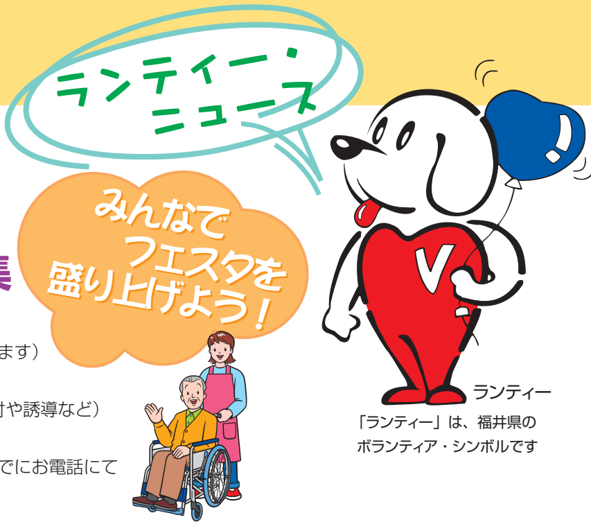
ランティアー 「ランティアー」は、福井県のボランティア・シンボルです