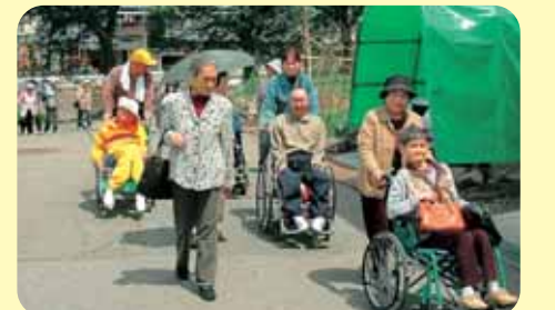
5月15日 すこやか周辺を散策しました

毎月第1・第3月曜日(祝祭日の場合はお休みです)午前10時から午後2時半まで、福祉健康センターすこやかで活動しています。ご希望のかたには、リフトバスでの送迎もできます。