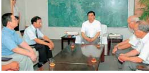
市長から認定を受けた昭和町3丁目・猪野瀬地区(上)と、大袋・中後区(下)

6月30日に昭和町3丁目区と猪野瀬地区が、8月2日には大袋区と中後区が、「かつやまをきれいにする運動」の趣旨に賛同して、「美しい環境づくり宣言区」を宣言し、市より認定書が交付されました。 この運動は、勝山の自然や景観を大切に、市民一人ひとりの意識により、「ごみを捨てない、捨てさせない」ことを地区で宣言して実践していくものです。