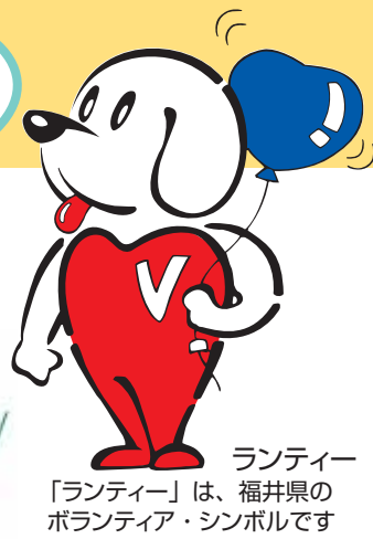
ランティーン「ランティーン」は、福井県のボランティア・シンボルです