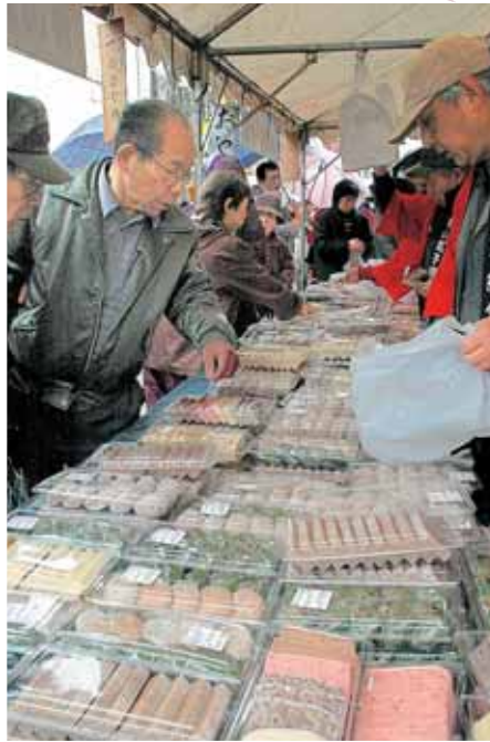
地区の特産品を求める 買い物客