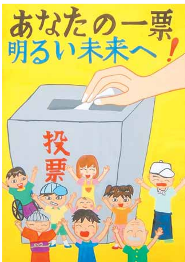
福井県明るい選挙啓発ポスターコンクール 銀賞 平澤史織さん（村岡小6年）の作品