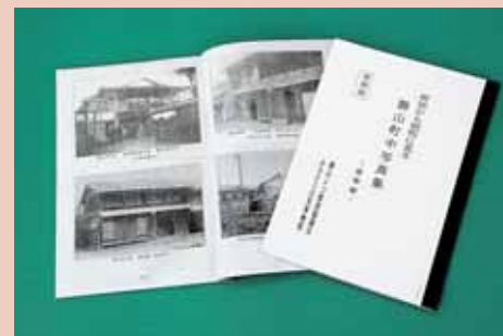
ご希望のかたは勝山公民館まで。(1冊2000円)

同協議会ではこのほか「昭和の勝山街道町中案内」「七里壁を歩く」を発行しており、勝山地区の遺産を掘り起こし、ふるさとの再発見に力を入れています。