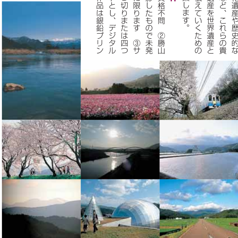
問 商工観光課内勝山写真コンテスト実行委員会(☎内線273)

①応募資格不問 ②勝山市内で撮影したもので未発表のものに限ります ③サイズは四つ切りまたは四つ切りワイドとし、デジタルカメラの作品は銀鉛プリン