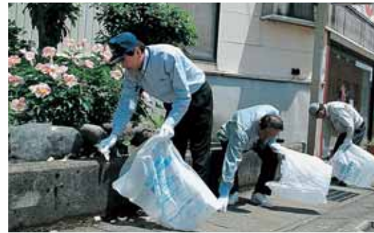
6月1日、市長も参加して市役所職員が昼休みに清掃ボランティアを行いました。約150人が参加し、トラック1台分のごみが集まりました。市では「かつやまをきれいにする運動」を展開しています。

世界的な経済誌「フォーブス」に掲載された「世界で最もクリーンな都市ランキング」では、何と勝山市が世界第9位、日本第1位に選ばれました。自他共に認める私たちのこのきれいな勝山を、環境月間を機に今一度見つめ直し、美しいまま、さらにはもっと美しい街として、子どもたちに受け継いでいきたいと思います。