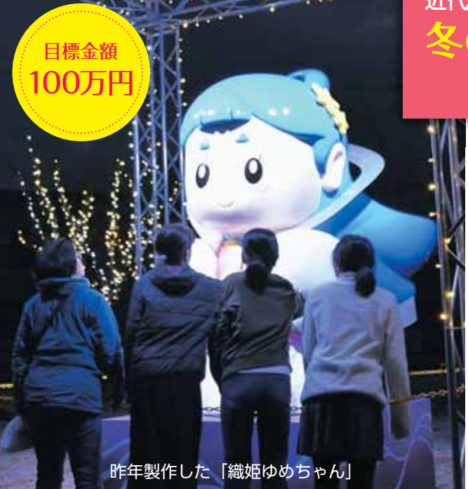
昨年製作した「織姫ゆめちゃん」

近代化産業遺産イルミネーションプロジェクト 冬の雪を光で彩り、 人々の心を温かく