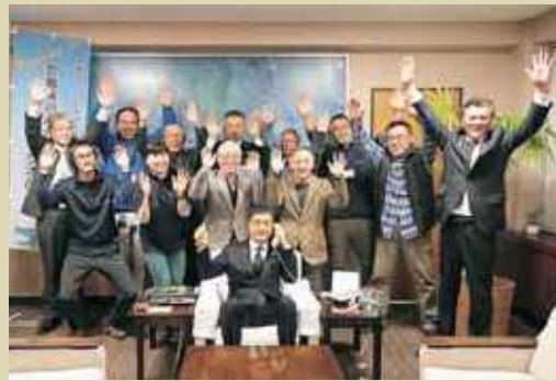
再認定の報告を喜ぶ協議会の方々

12月25日に開かれた日本ジオパーク委員会で、「恐竜渓谷ふくい勝山ジオパーク」の日本ジオパーク再認定が決定しました。