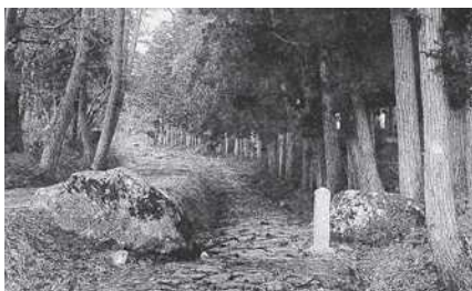
大正末期の菩提林