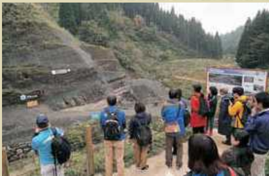
審査員によるツアー視察（発掘現場）

思いがジオパークを形作りつつある」「地域文化や地域資源を尊重した活動が地域振興につながり、ポトムアップで推進するジオパーク活動の一つのモデル」と高い評価を受けました。課題としては、ジオサイトの保全計画やマーケティング戦略の充実が挙げられています。 今後は、その課題を十分意識しながら、関係団体と更に連携を深め、当ジオパークにしかない地形・地質遺産の保護・保全はもちろん、自然・歴史・産業などの遺産の魅力アップと持続可能な地域の発展につなげていきます。