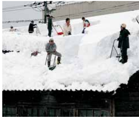
屋根雪下ろしは1人で行わないように

●除雪車には近づかないで！ ・作業中の除雪車は、非常に危険なので近づかないようにしましょう