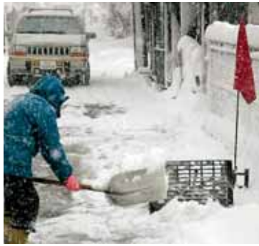
投雪口には赤旗の提示を

●雪に対するルールとマナーを守りましょう！ ・路上駐車はやめましょう。車道除雪の支障となります ・水道水による融雪・消雪はやめましょう。断水の原因となります ・重機などを使用しての大量排雪はやめましょう。側溝や水路などの雪詰まりや、付近住宅の浸水を引き起こす原因となります（大量に排雪する場合は、市指定の排雪場所へ） ・開いたグレーチング（投雪口）には、必ず赤旗などを立てましょう。歩行者、自動車などの転落防止のためです。また、作業終了後は、必ずグレーチングを閉めましょう ・屋根には、落雪防止のため、必ず雪止めを設置しましょう