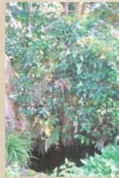
写真は「東尋坊跡」の標柱と、その井戸跡

「越前地理指南」(貞享二年「一六八五」の著書)の足羽郡の項に、「一、東尋坊池海岸にアリ 敷高く切岸巒て屏風を立てることく、池の深サ五丈五尺巖の高七丈余 ノ広八間奥へ廿二間 内二鮑栄螺など多シかつき(商い)の海士潜てとる むかし平泉寺二東尋坊と云僧アリ 強力悪僧にて一山の衆徒等にくみ猜む事甚し 或時衆徒等此辺逍遙遊覧せし事有しに 東尋坊酒に酔たる所を傍なる法師此池へ岸波と突落しける時 東尋坊其僧と脇なる児を左右に搦て共に池に入 猶此悪霊怒て忽に空かき曇り震動雷多して人数多損害す」今も四月五日の平泉寺神事は東尋坊の悪霊がこの池より出て平泉寺へ行くので、天候が荒れ地元の人でも船出を控えるという、とある。