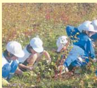
小学生のそば刈り体験

交付金の50%以上が、集落の活性化を目指し、水路・農道などの維持管理、鳥獣害防止対策、下草刈りなどの共同取り組み活動に充てられています。